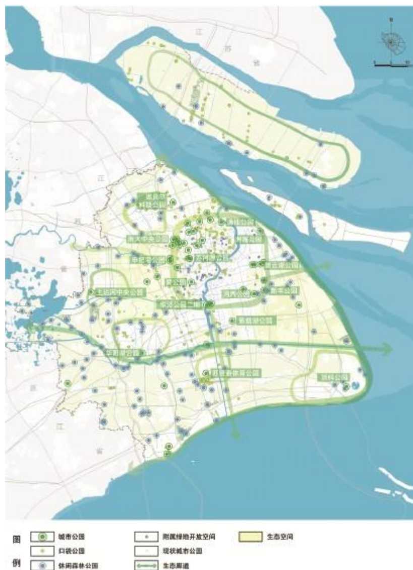
图4 上海市“十五五”公园绿地建设布局示意

州湾近岸海域、青西淀山湖区、九段沙等重要湿地修复。深入实施生物多样性保护战略与行动计划，推进野生动物栖息地修复与种群恢复，持续巩固互花米草治理成效，推进上海辰山国家植物园设立。支持“生境+”复合生境系统建设，建设一批社会多方参与的社区生境花园。