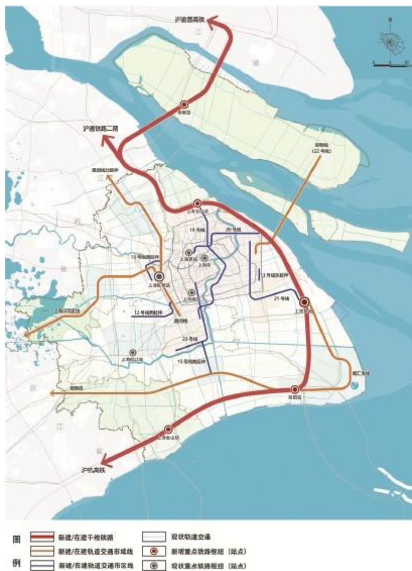
图 3 上海市“十五五”轨道交通建设示意

轨道交通市区线 and 市域线运营总里程达到 1260 公里以上，进一步提高中心城轨道交通覆盖 盖率。完善骨干路网规划建设，建成沿江通道浦东段，推进 S5、S20 等公路功能提升和 南北通道建设，启动 S2 公路临港段通道扩容，推进内环高架年轻化综合改造，开展 S7、 S22 等公路规划研究，高快速路里程达到 1200 公里左右。优化城市道路级配和布局，持 续建设越江跨河设施，提升城市路网通行效率。