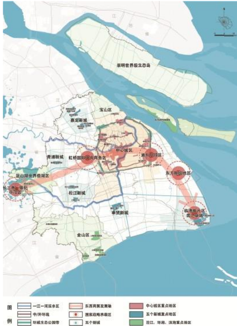
图2 上海市“十五五”城市功能空间布局示意